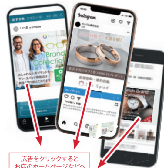
広告をクリックするとお店のホームページなどへ

「これは売れる」と自信のある商品や、「お客様に喜ばれている」と感じるサービスでも、多くの人には知られていない、実際の来店・購入につなげるのは簡単ではない。かつてはチラシなど紙媒体の効果が大きかったが、近年はその影響力が徐々に小さくなっている。今、集客で鍵を握るのは、日本での普及率が約98%に達しているという「スマートフォン」だ。日常的にスマホを手にする人が大多数となったことで、「スマホ上でどれだけ効率よく情報を届けられるか」が、認知拡大の成否を左右している。