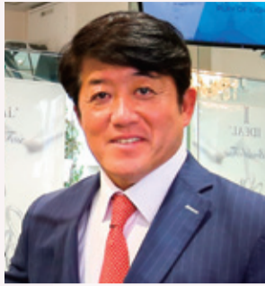
(株)AP代表取締役 (株)Pure Diamond代表取締役 AWDC Diamond & Antwerp大使 (一社)日本グロウンダイヤモンド協会代表理事