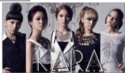
KARA (韓国アーティスト)