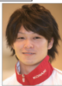
内村航平 (ロンドンオリンピック 金メダリスト)